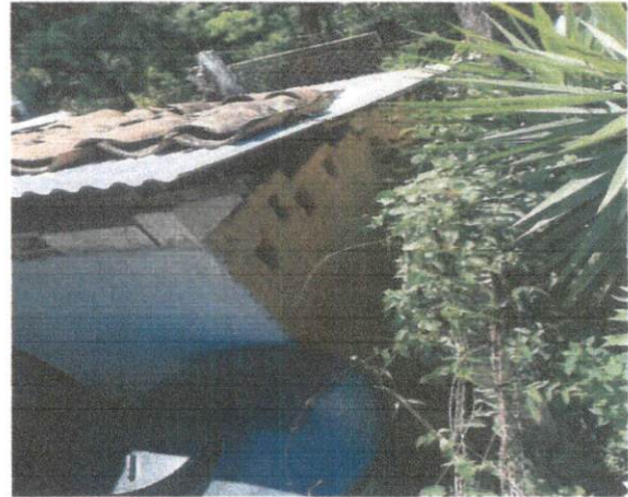
Foto 2: Mejoramiento y ampliación de la cocina que esta fabricada de adobe.