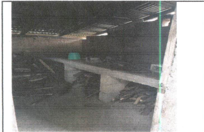
Foto 3: Instalación de hornillas. Piso, sistema eléctrico con iluminación y azulejos en paredes y puerta