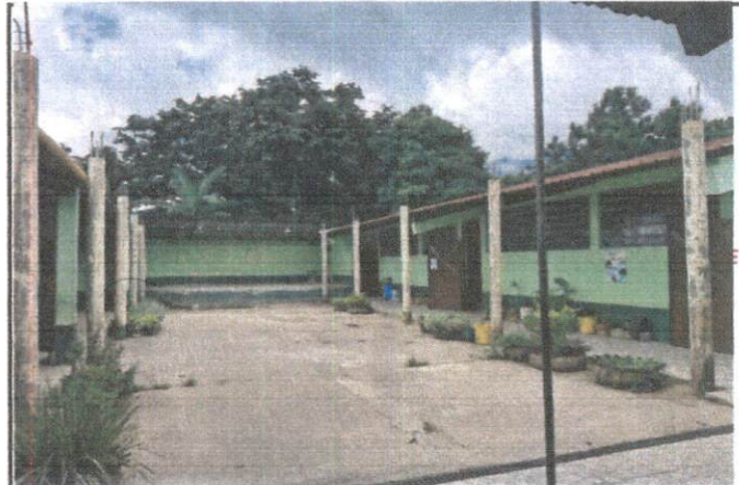
Foto 4: Estructura, entechado, instalación de canales, instalación de sistema eléctrico e iluminación en el patio del establecimiento educativo.

Observación: Si es necesario se pueden agregar hojas adicionales y actualizar el número de hojas.